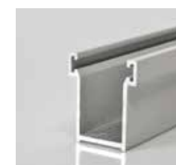
ART. P.E27N.T Guida in alluminio E27N E27N Aluminium Guide