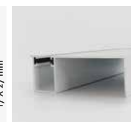
ART. P.EGD30N.T Guida in alluminio EGD30 EGD30 Aluminium Guide

CONSULTARE TABELLA COLORI E RELATIVA DISPONIBILITÀ A PAGINA 138/139. LOOK UP IN THE COLOURS LIST AND THEIR RELATIVE AVAILABILITY AT PAGES 138/139.